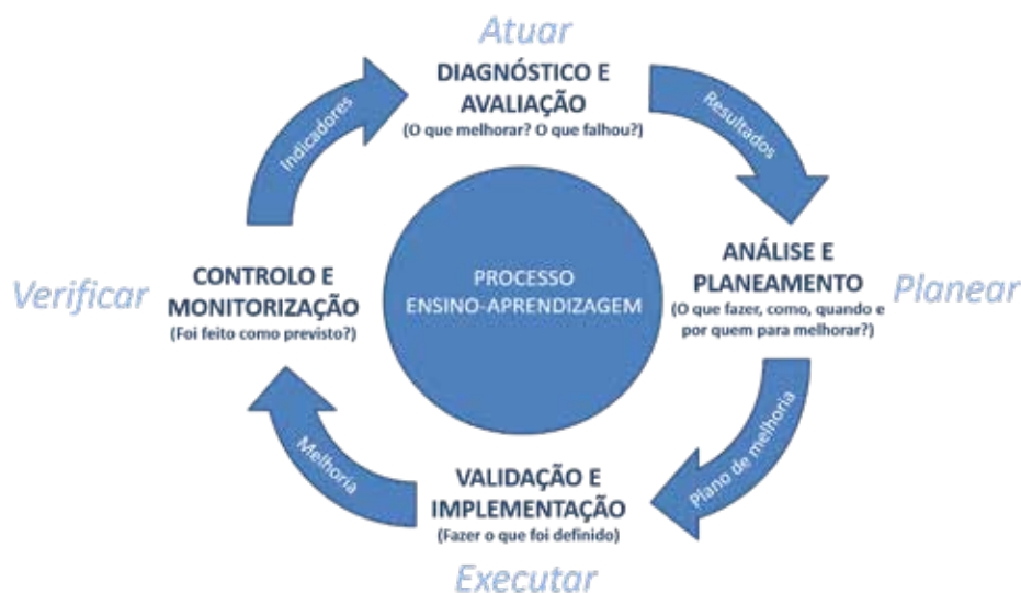
Figura 2: Ciclo de avaliação do desempenho do Processo Ensino-Aprendizagem (adaptado de Interpretação APCER ISO 9001:2008)

O principal objetivo é a avaliação do funcionamento dos Cursos da UTAD e a elaboração e respetiva implementação de planos de melhoria, de forma a minimizar e, se possível, eliminar as situações anormais identificadas no seu funcionamento (ver Figura 2).