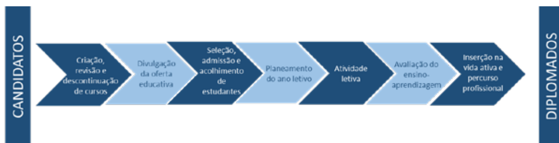
Figura 1 – Subprocessos do Processo Ensino-Aprendizagem (Adaptado de Pires, A. e Lourenço, R., 2013)

Para que um candidato ingresse na Universidade e percorra todo o processo ensino-aprendizagem, obtendo no final o diploma que lhe permitirá ingressar no mercado de trabalho, várias atividades terão que ser realizadas, respeitando procedimentos devidamente estabelecidos. Este conjunto de atividades realizadas constituem os subprocessos, onde a saída (resultado) de cada um é a entrada (recurso) do subprocesso seguinte ou de um subprocesso que está mais à frente na cadeia (Figura 1).